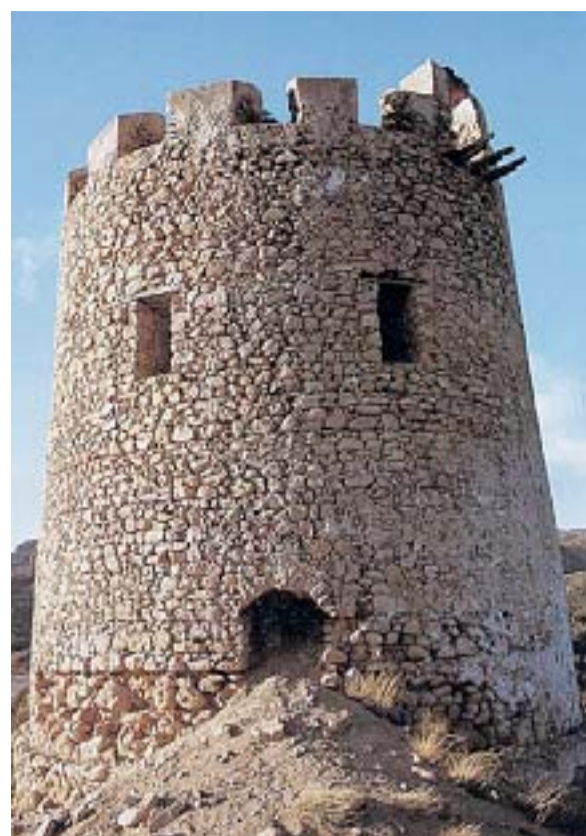
Torre Murtas, una delle torri spagnole in Sardegna